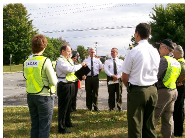
« Briefing » d'avant campagne avec tous.