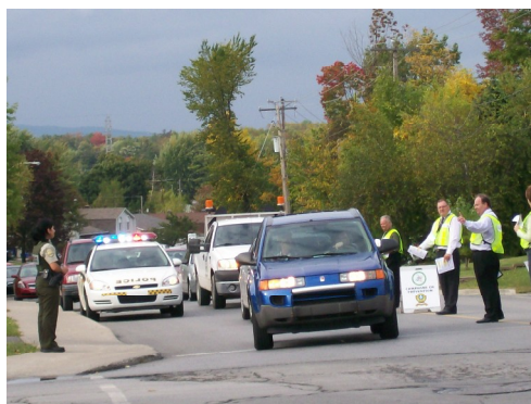
Les bénévoles en action sous l'œil attentif de l'agent Linda Pelletier.